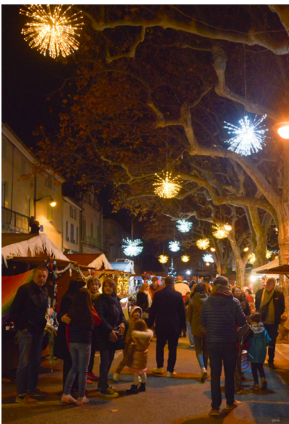
Les chalets de Noël.