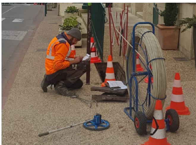
Déploiement de la fibre optique sur l'ensemble du village.