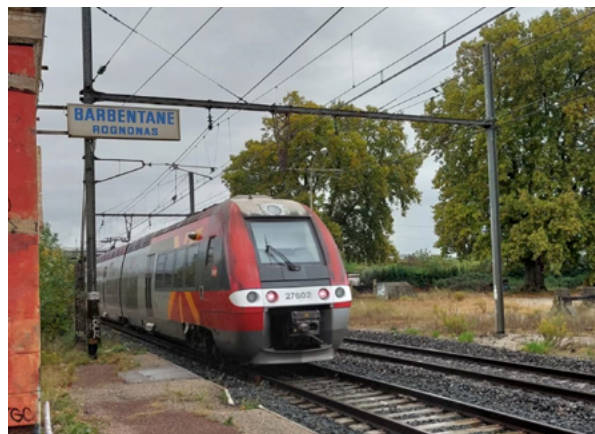
Gare de Barbentane