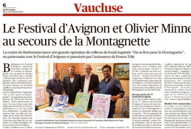
Article de La Provence