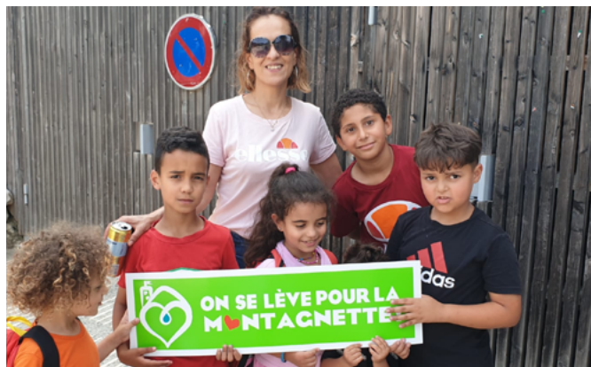
Opération "On se lève pour la Montagnette"