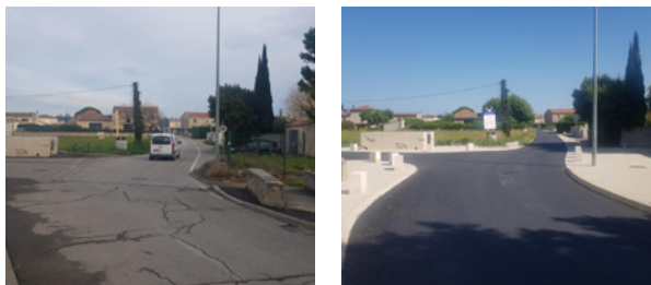
Travaux Ramière avant-après.