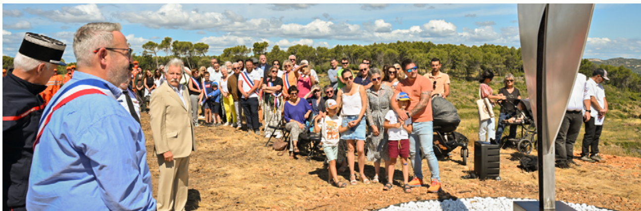
Inauguration de la stèle commémorative en hommage au lieutenant Martial Morin, décédé lors des incendies de la Montagnette.