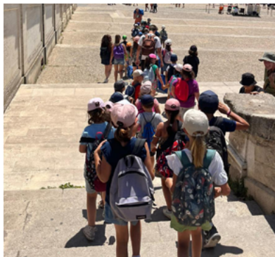
Sortie à Avignon.