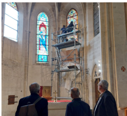
Rénovation de Notre Dame des Grâces