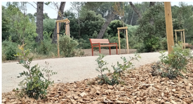
Les jardins de l'EHPAD