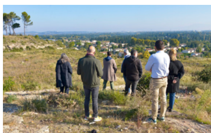
Étude théâtre de verdure