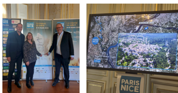
Étape du Paris-Nice 2026 à Barbentane