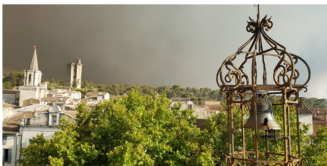
Les terribles incendies de la Montagnette