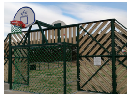
City stade au Pigeonnier.