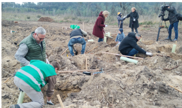
Plantation de milliers d'arbres sur la Montagnette