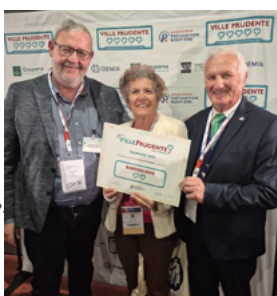
Label "Ville prudente"