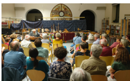
La médiathèque rénovée