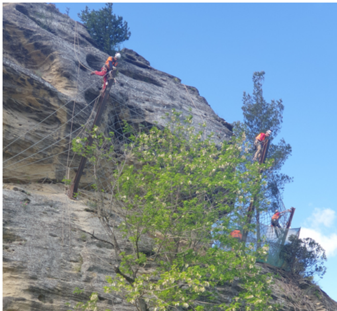
Sécurisation du risque de chute de blocs liés aux falaises.