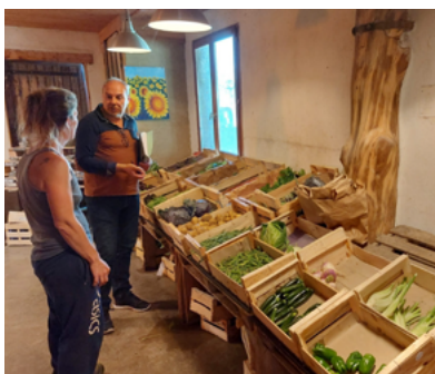
Cantine scolaire : achat local en circuit court avec Paysans Bio Direct.