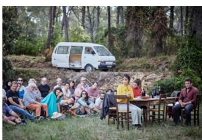
Représentation de "Que ma joie demeure"