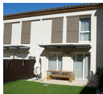
Inauguration des 20 logements du Clos César