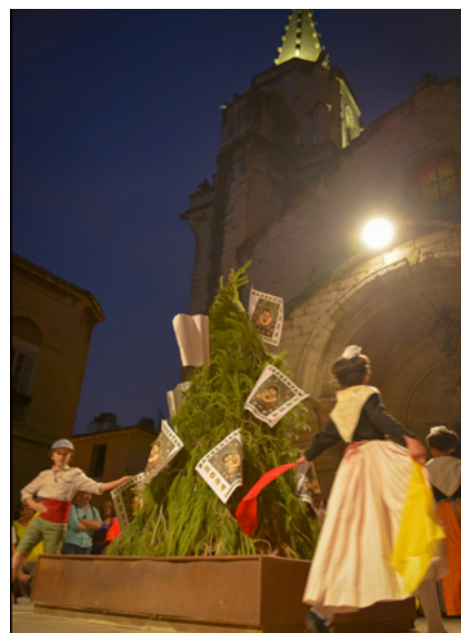
Fête de la Saint Jean