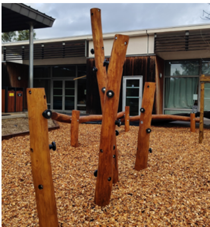
Désimperméabilisation des cours.