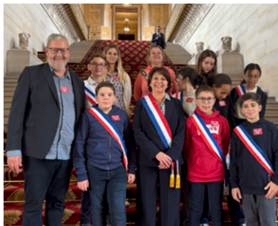
Conseil municipal des jeunes au Sénat.