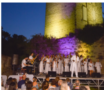
Les Jeudis de Barbentane