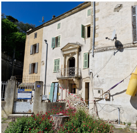
Immeuble Fontaine, avenue Bertherigues