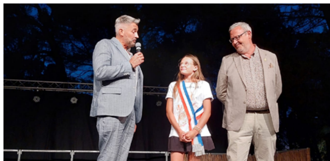
La grande soirée caritative "La Montagnette en fête"