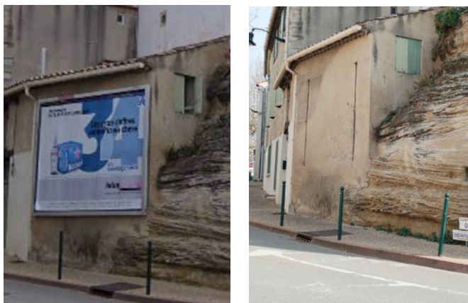
Lutte contre la pollution visuelle - Croisement rue sous l'hôpital.