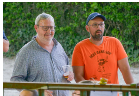
Les Bois sans soif.