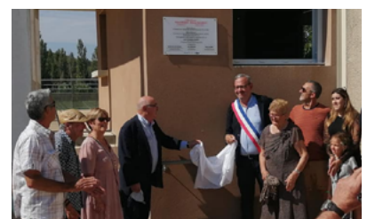
Inauguration de l'extension des vestiaires.