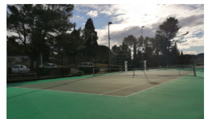
Rénovation des courts de tennis.