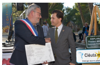
Remise du label « Ciéuta Mistralenco »