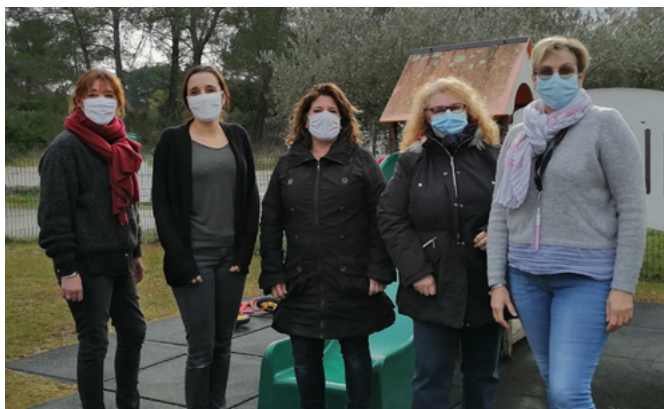
Équipe de la crèche municipale - section des grands