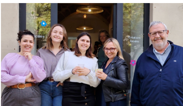
Les filles de Barbentane