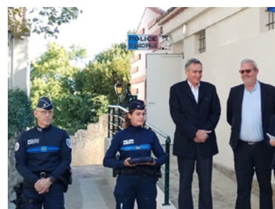
Nouveau poste de police municipale.