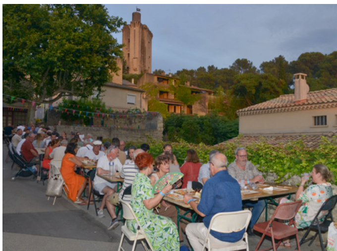
La promenade gourmande.